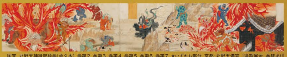
国宝 北野天神縁起絵巻(承久本) 巻第2、巻第3、巻第4、巻第5、巻第6、巻第7 *いずれも部分 京都・北野天満宮 [通期展示、巻替あり]

京都国立博物館 KYOTO NATIONAL MUSEUM 平成知新館【東山七条】 〒605-0931 京都市東山区茶屋町 527 電話 075-525-2473 (テレホンサービス) https://www.kyohaku.go.jp/